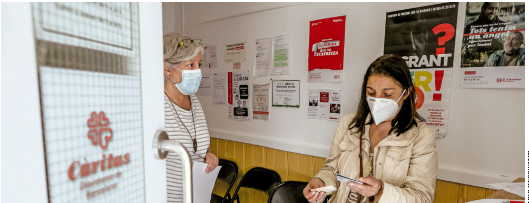
Més del 50% de les famílies ateses mai havien necessitat l'ajuda de Càritas

Text de Jordi Julià Sala-Bellsollé