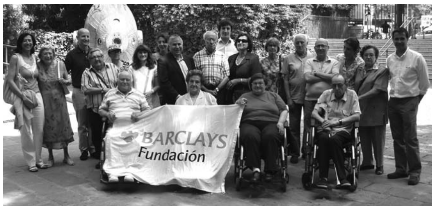
Visita a l'exposició Tutankhamon

El 23 de juny, tretze usuaris del Centre de dia Casc Antic, gestionat per Càritas, van poder visitar l'exposició "Tutankhamon: Descobreix la tomba i els seus tresors" ubicada al Museu Marítim de Barcelona, gràcies a la col·laboració de Fundación Barclays, entitat que col·labora activament amb el programa Empreses amb Cor des de l'any 2008.