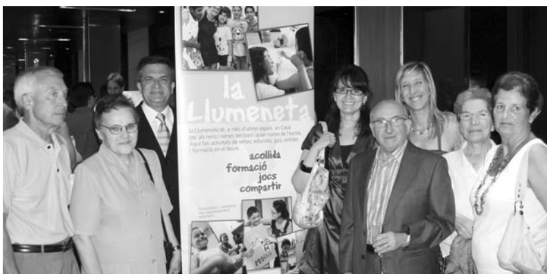
Voluntaris de La Llueneta

Més de sis-centes persones es van reunir el 15 de juliol a la nit per celebrar el 3r aniversari de l'Hotel Hesperia Tower; situat a L'Hospitalet de Llobregat, amb motiu de la celebració d'un sopar solidari a benefici de Càritas.