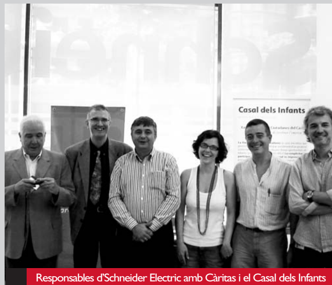
Responsables d'Schneider Electric amb Càritas i el Casal dels Infants

La missió del Projecte Luli és ajudar especialment els infants i joves amb algun tipus de discapacitat física, intel·lectual o en situació de risc social. Aquest any, però volen reforçar la seva política de RSC de manera innovadora, ajustant el Projecte Luli al Programa Corporatiu BipBop, el qual pretén apropar l'electricitat als col·lectius més vulnerables. Per això, es desenvolupa un pla de col·laboració amb la Fundació Bip Bip en dues accions diferenciades: la implantació d'Aules Tecnològiques a les associacions col·laboradores i l'endegament d'un Portal de Microvoluntaris a través d'una pàgina web disponible en la Intranet local de l'empresa que permetrà que els col·laboradors d'Schneider Electric puguin dur a terme un voluntariat virtual amb les associacions amb què el Projecte Luli col·labora.