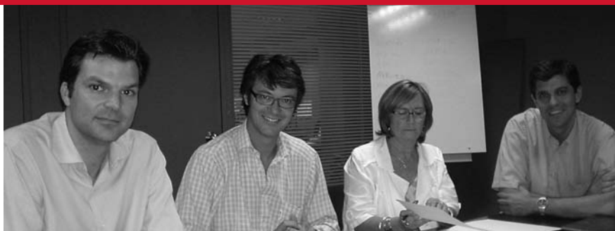
Signatura del conveni entre Atrápalo i Càritas

Durant les dues hores de concert, els músics participants van convidar una sala plena de públic a gaudir de bona música i a col·laborar amb Càritas perquè puguem continuar treballant per millorar les condicions de vida de les persones.