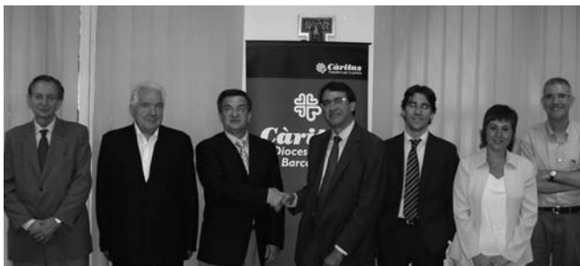
Acte de signatura del conveni amb la Fundació Politècnica

El 23 de juliol va tenir lloc a la seu de Càritas Diocesana de Barcelona la signatura del conveni de col·laboració entre la Fundació Politècnica de Catalunya i Càritas.