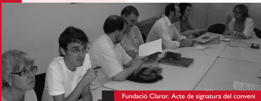
Fundació Claror. Acte de signatura del conveni

El projecte "Futbol al barri" neix de la necessitat de treballar per a la integració d'infants i adolescents dels barris de Ciutat Nord-Vallbona, Ciutat Meridiana i Torre Baró, molts dels quals viuen en un ambient de desestructuració familiar i relacional.