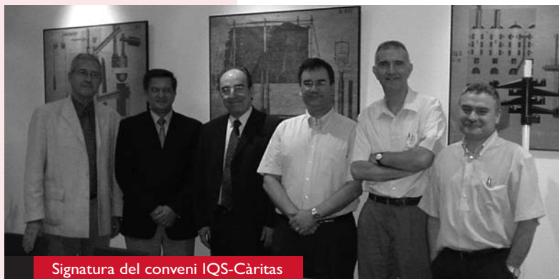
Signatura del conveni IQS-Càritas

Posteriorment, s'efectuà una reunió de treball per tal d'anar precisant la planificació d'activitats per al curs 2009-2010.