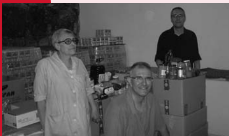
Lliurament d'aliments al Magatzem de Càritas

De nou, Zurich España ens ha sorprès amb el desenvolupament d'una iniciativa solidària. A proposta de diferents treballadors i treballadores d'aquesta empresa, durant tot el mes de juliol van organitzar una campanya interna de recollida d'aliments, de manera similar a com ho havien efectuat el passat Nadal. Aquest "Nadal a juliol" respon a la sensibilització de Zurich sobre la difícil problemàtica que estan passant moltes famílies i persones ateses per Càritas que, per causa de la crisi, necessiten cobrir les seves necessitats més bàsiques.