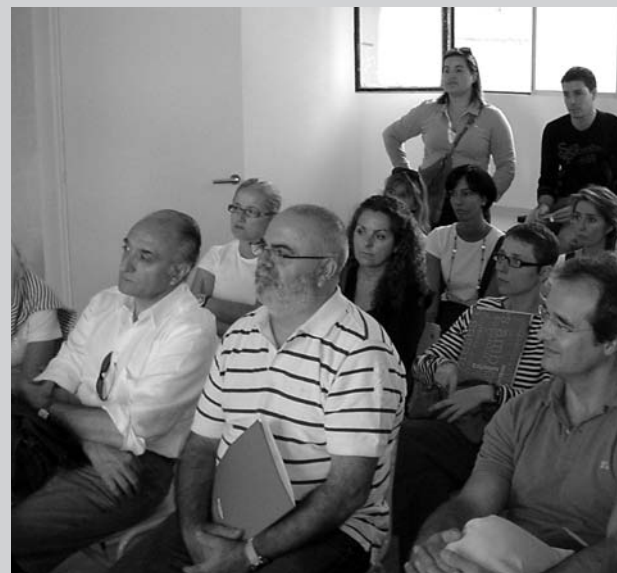
Visita de Firmenich al Centre Glamparetas