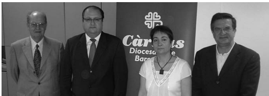
IMOI i Càritas comencen la seva col·laboració

Durant aquest estiu s'ha iniciat la col·laboració de l'Institut Mediterrani d'Odontologia i Implantologia (IMOI) amb Càritas, en el marc del conveni de col·laboració signat al mes de juny, pel qual l'IMOI facilitarà tractaments odontològics a infants atesos per Càritas Diocesana de Barcelona.