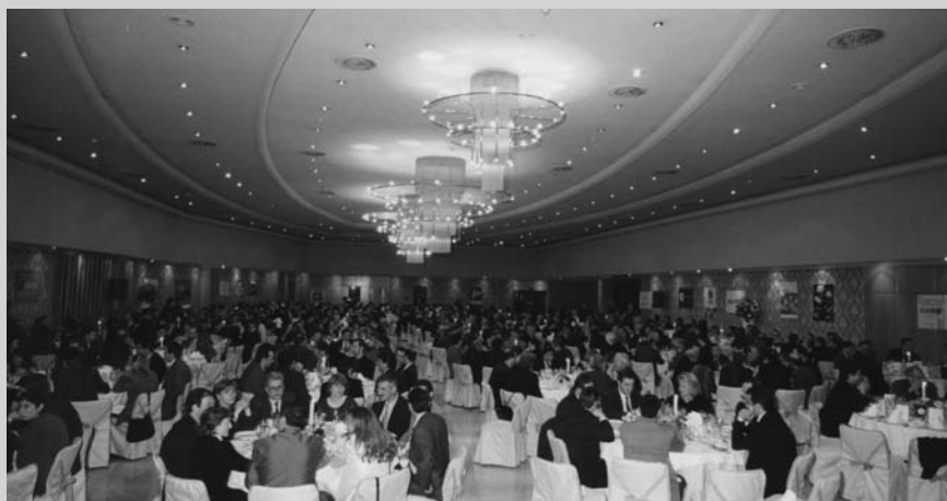
Sopar de les Telecomunicacions, 2008

Les empreses i institucions podran adquirir un paquet d'entrades per destinar als seus comitès de direcció o per als seus clients i amics. També les empreses o institucions que ho considerin necessari podran fer una aportació solidària especial tot adherint-se a la Taula Zero del sopar solidari al preu de 100 euros el cobert.