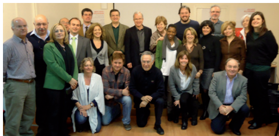
Equipo de voluntarios del Servicio de Mediación de la Vivienda.

1 Proyecto impulsado por el Sr. Cardenal Arzobispo de Barcelona, el Emmo. y Rvdmo. Lluís Martínez Sistach con motivo del 50º aniversario de su ordenación sacerdotal.