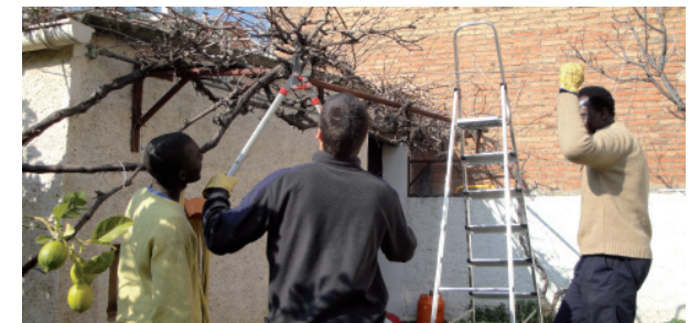
Curso de jardinería de Terrassa.