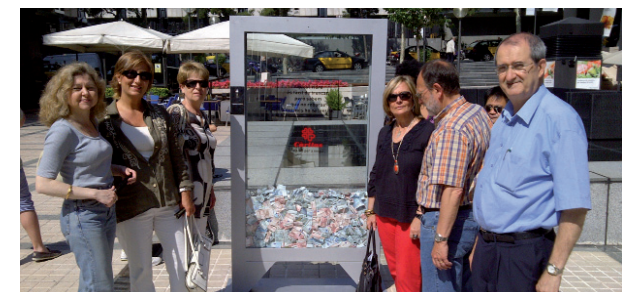
Voluntarios de Cáritas ante la urna-hucha de la campaña "Un No para nadie", creada por la agencia de publicidad Bassat Ogilvy.