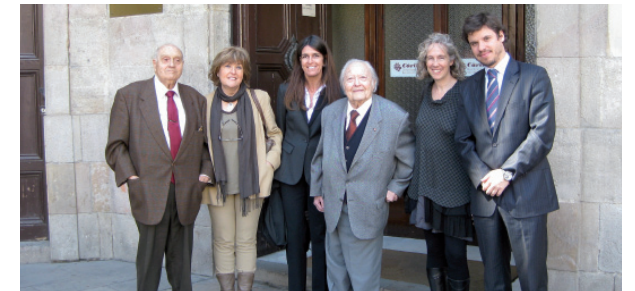
60º aniversario de la Asesoría Jurídica General de los abogados voluntarios de Cáritas (en 2011 atendieron a 408 personas).

Las cuentas están auditadas por la auditora Deloitte & Touche.