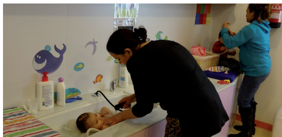
Apoyo Centro materno infantil de Rull (Barcelona).